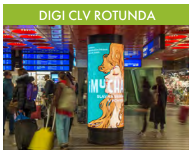
DIGI CLV ROTUNDA